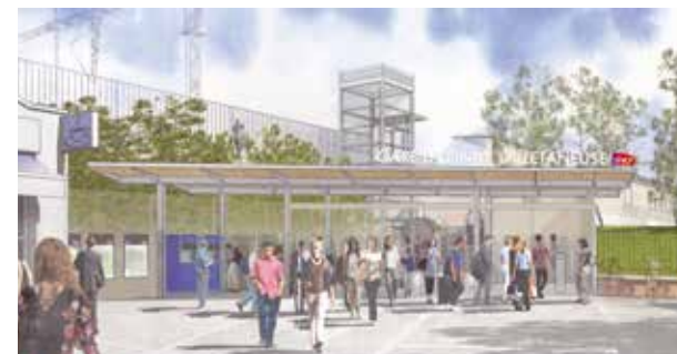
Futurs aménagements de l'accès Place des Arcades

L'ACCÈS DES ARCADES RÉNOVÉ POUR LE CONFORT DE TOUS