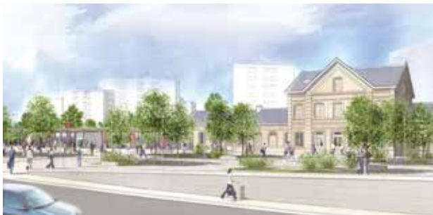
Futur parvis de la gare

Pour cette nouvelle phase, le projet IMPAQT vise plus particulièrement à moderniser l'accès vers la Place des Arcades.